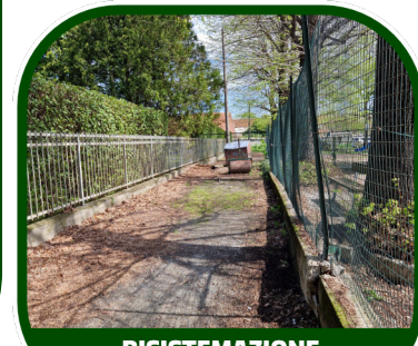
RISISTEMAZIONE CAMPO BOCCE