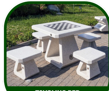
TAVOLINO PER SCACCHI E DAMA