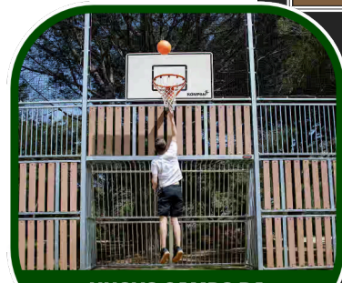
NUOVO CAMPO DA STREET-BASKET