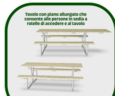
Tavolo con piano allungato che consente alle persone in sedia a rotelle di accedere e al tavolo