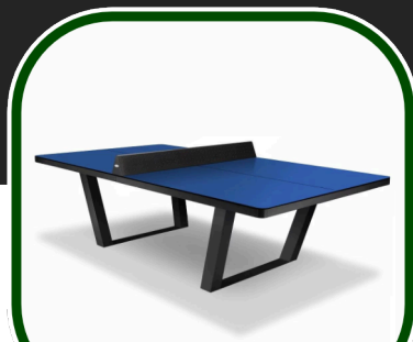
TAVOLO DA PING PONG