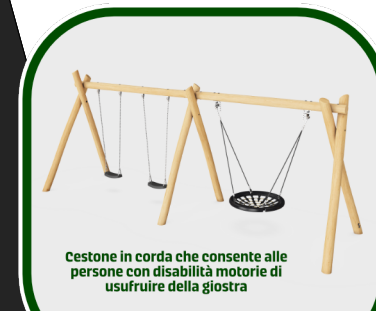
Cestone in corda che consente alle persone con disabilità motorie di usufruire della giostra