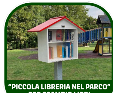
"PICCOLA LIBRERIA NEL PARCO" PER SCAMBIO LIBRI CROOSBOOKING