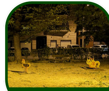
RECUPERO VECCHIE GIOSTRE